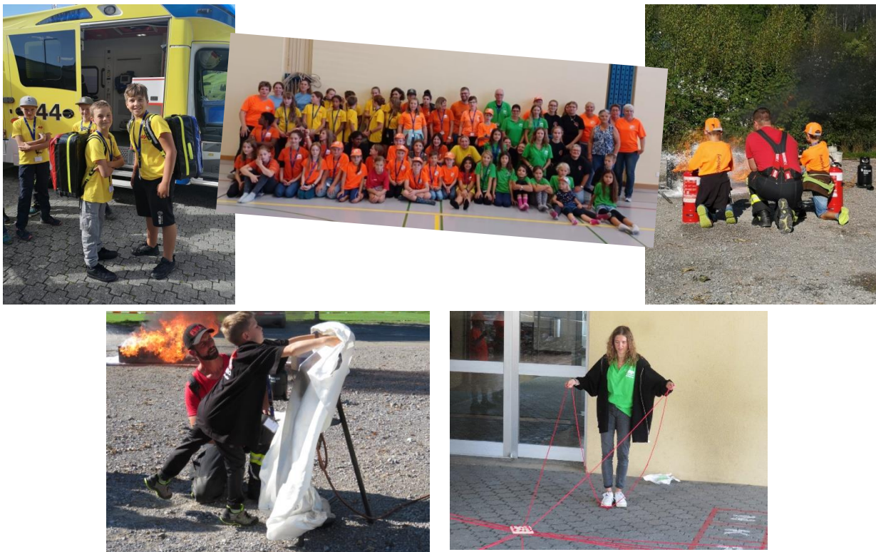
Eindrücke Help-Tag 2022 in Ebnat-Kappel